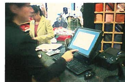
Auch optisch bietet das B+S supreme eine Ergänzung zur Kasse von Limmer Soft.

Seit 1983 beschäftigen wir uns mit Warenwirtschaft und Kassen für den modischen Einzelhandel (Textil, Sport, Schuhe und Schmuck). Es freut uns besonders im Jahr unseres 25-jährigen Jubiläums, unseren Kunden mit dem B+S supreme wieder ein innovatives Produkt an die Hand geben zu können, das die Funktionalität unserer Kassenlösung weitererhöht.